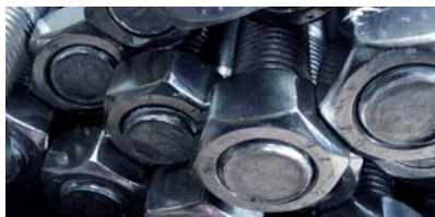
Jurec | pietro.de